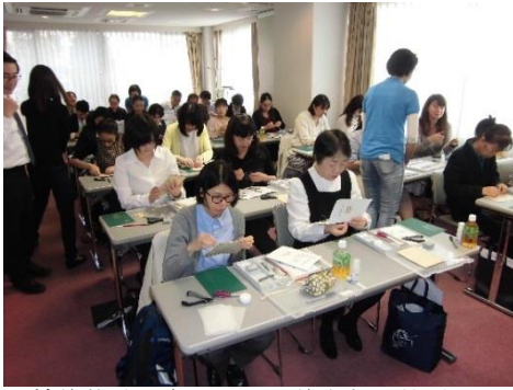
補修体験に奮闘する研修参加の皆様